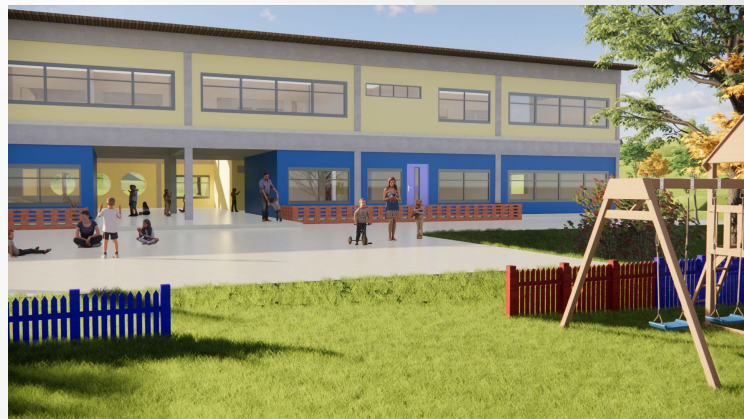
Proposta para área externa