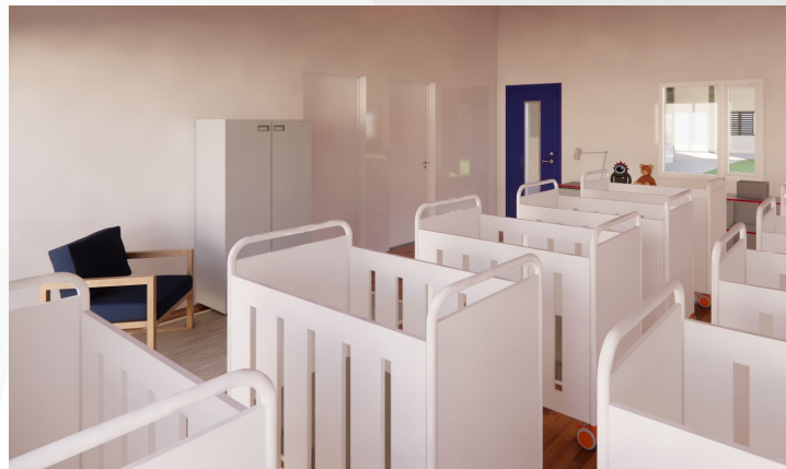
Imagens de projeto.